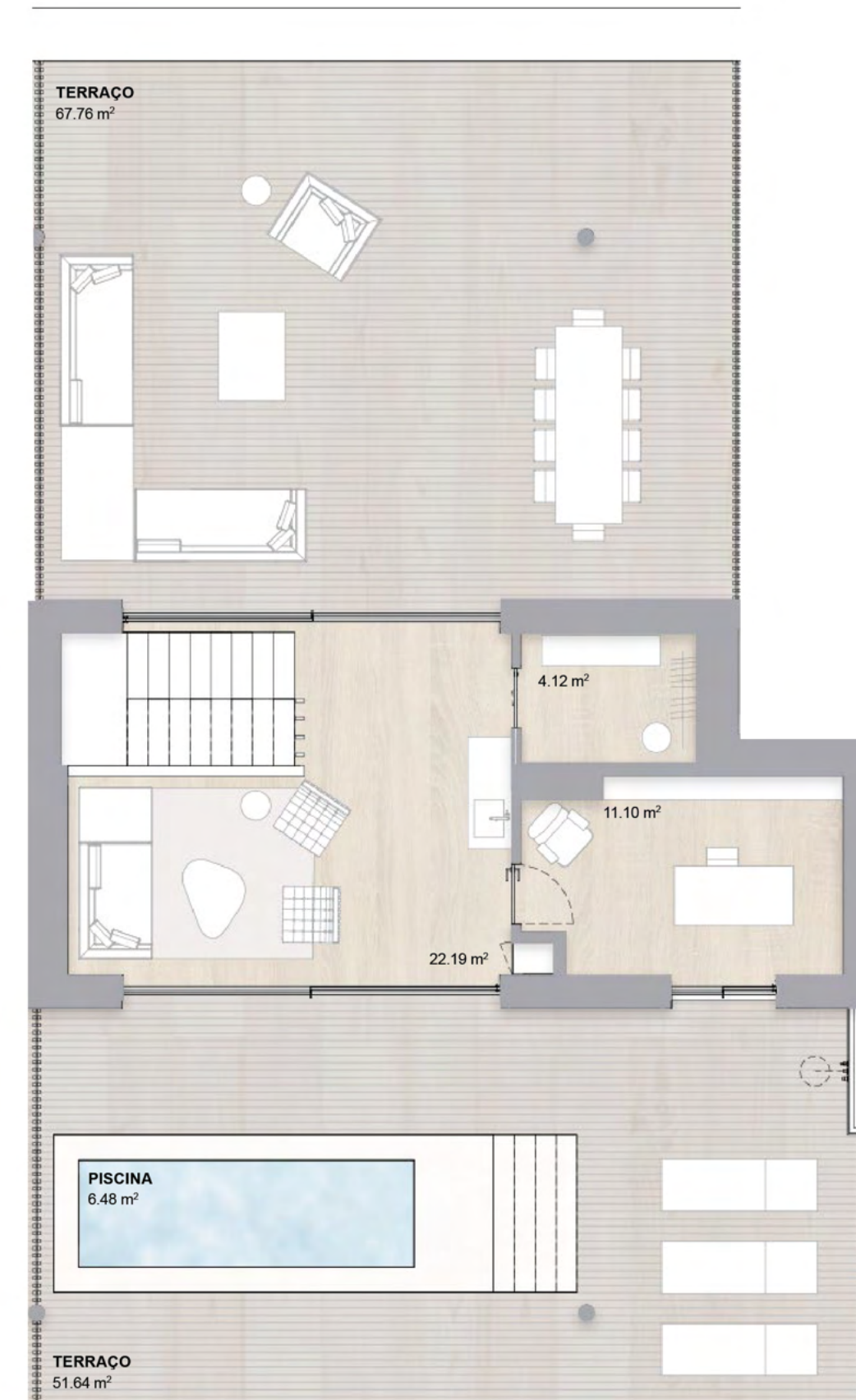
3º ANDAR THIRD FLOOR