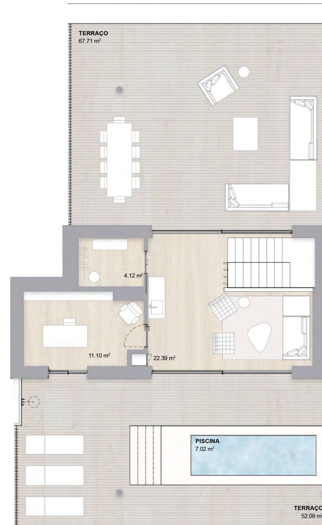
3º ANDAR THIRD FLOOR