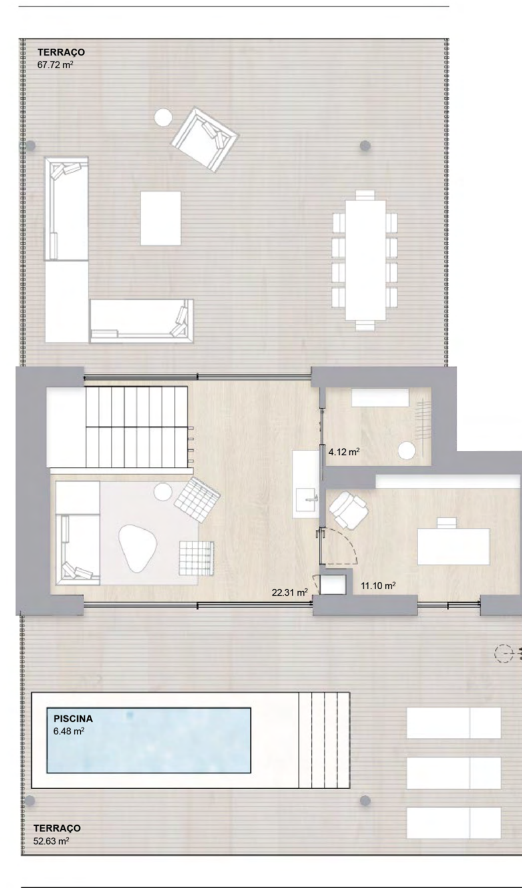
3º ANDAR THIRD FLOOR